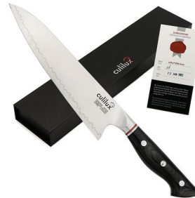
KOBE Serie Küchenmesser KOBE Series Kitchen Knives