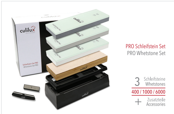
PRO Schleifstein Set PRO Whetstone Set